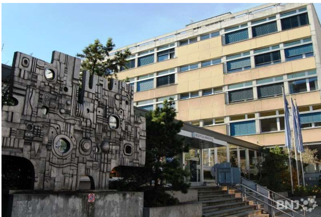
Le CPLN va rejoindre le CIFOM et le CPMB pour former un seul et grand centre de formation professionnelle cantonal.

La formation professionnelle neuchâteloise se réorganise. Le Conseil d'Etat a annoncé vendredi le futur regroupement des trois grands centres cantonaux de formation professionnelle, le CIFOM, le CPMB et le CPLN, ainsi que d'une partie du lycée Jean-Piaget