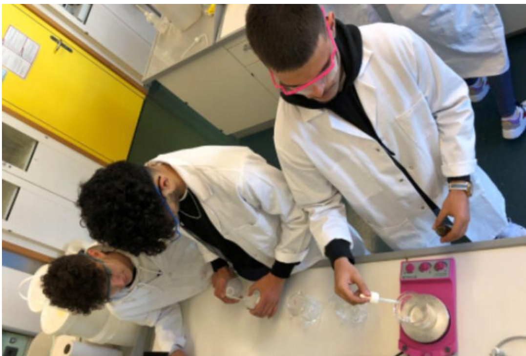
Les étudiants ont participé aux différentes phases de création des produits.

Des étudiants de l'École du secteur tertiaire à La Chaux-de-Fonds ont créé des produits de nettoyage plus sains et écolos qui seront utilisés dès la rentrée pour l'entretien de l'école