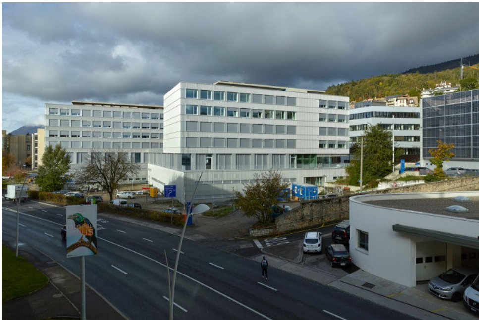
Les travaux au CPLN auront duré cinq ans.

Les travaux sont terminés au Centre professionnel du Littoral neuchâtelois. Les étudiants bénéficient de locaux entièrement rénovés