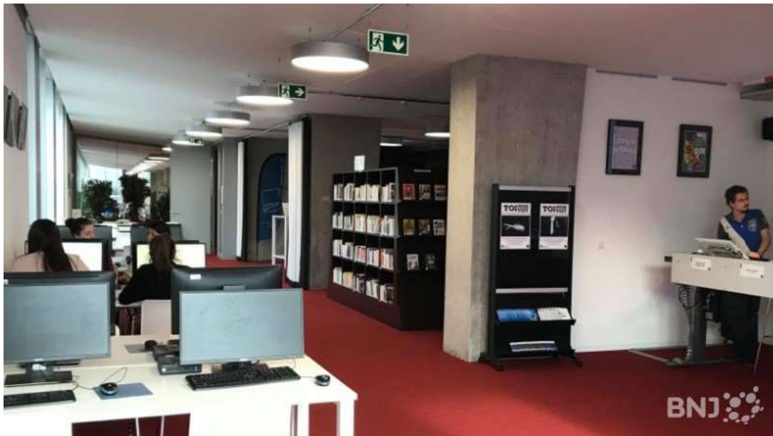
Le nouvel espace de travail du CPLN, le "Carré bleu".

Le Centre professionnel du Littoral neuchâtelois à Neuchâtel a officiellement inauguré son « Espace culture et technologies » lundi. Celui-ci a pris la place de l'ancienne médiathèque et vise à répondre à de nouveaux défis pédagogiques