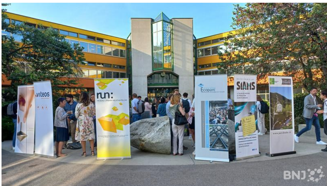
Une cinquantaine d'étudiants participe au challenge MicroCité.

Une cinquantaine d'étudiants de l'Université de Neuchâtel, de la HE-ARC, du CIFOM et du CPLN participe au challenge MicroCité. Jusqu'à vendredi, ils devront répondre de manière innovante à 10 défis proposés par des entreprises et acteurs socio-économiques de la région